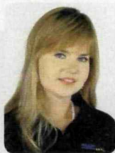
Anna Lewińska Portal Podróży www.holidaycheck.pl